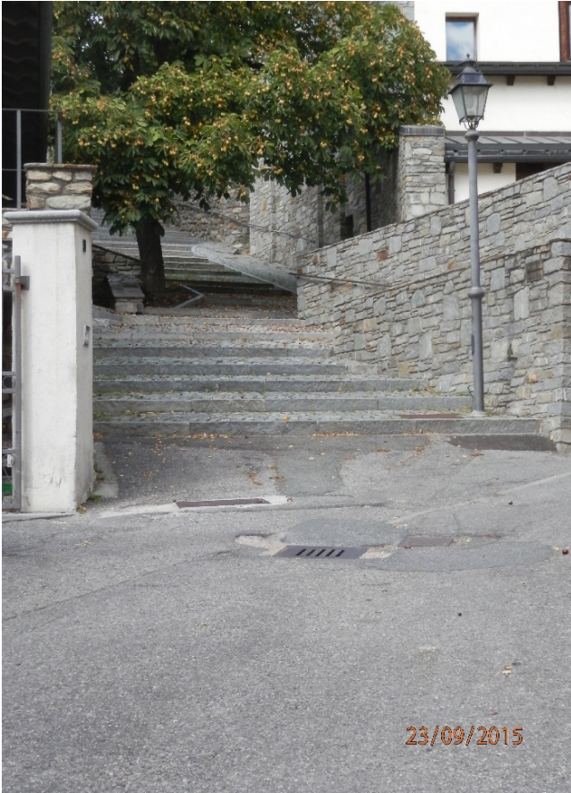
Scalinata nel Borgo.