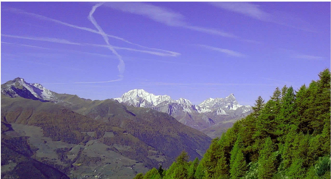
Il Monte Bianco e la catena delle Grand Jorasses.