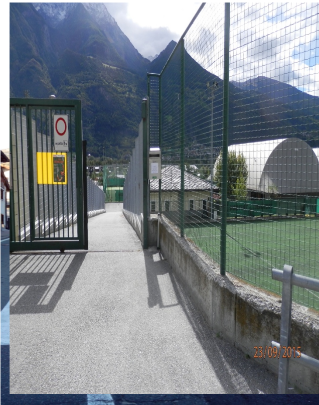
Uscita dallo stadio, salita in asfalto.