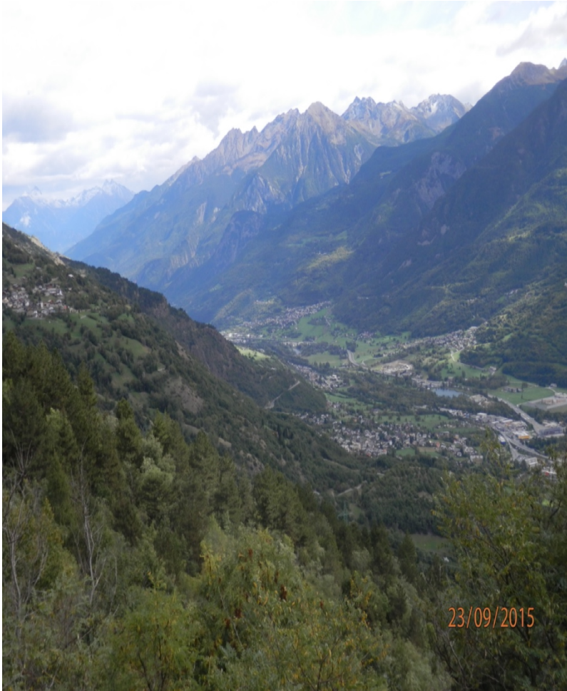
Visione panoramica della bassa valle.