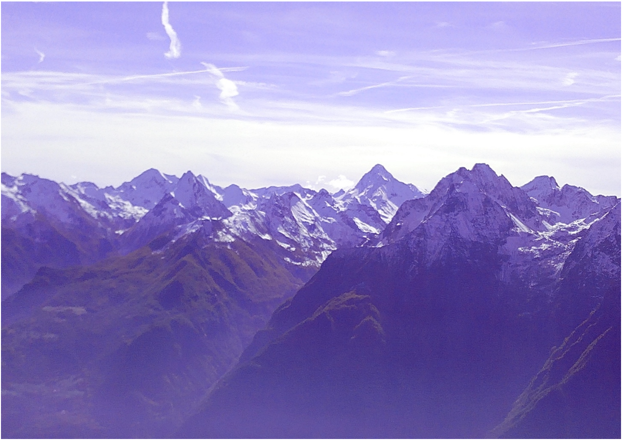
Bassa Valle con alcune vette del Piemonte.