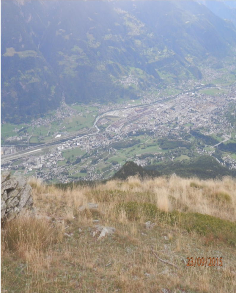
Aosta q. 560