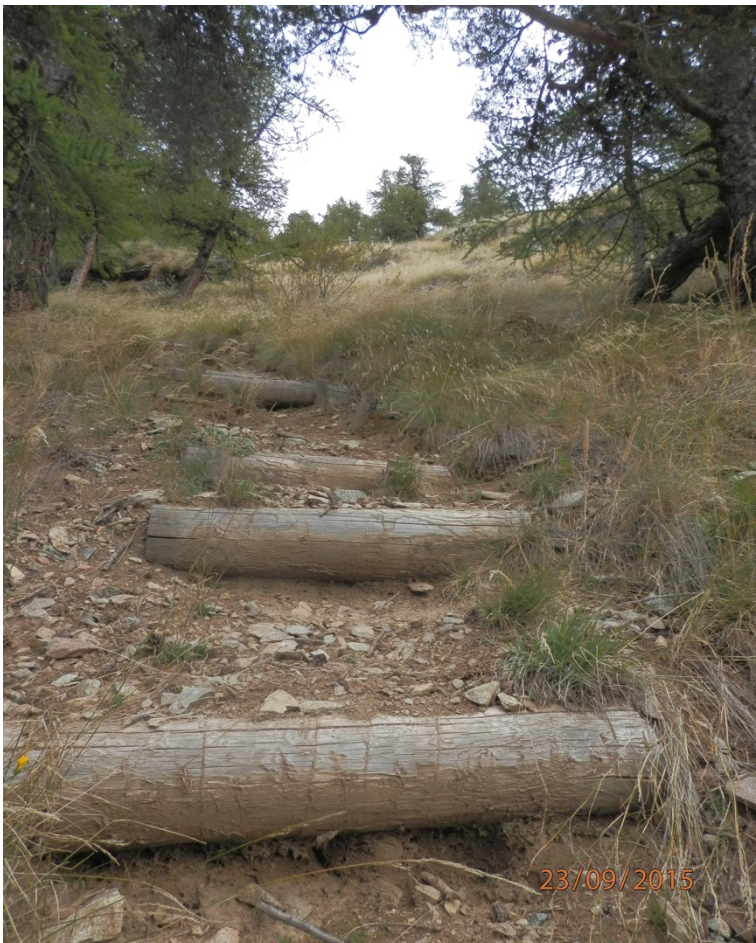
Tratto ripido, gradini in legno.