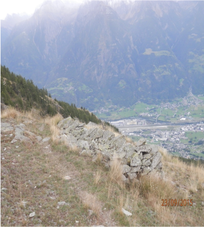
1500 m. Vista panoramica su Aosta.