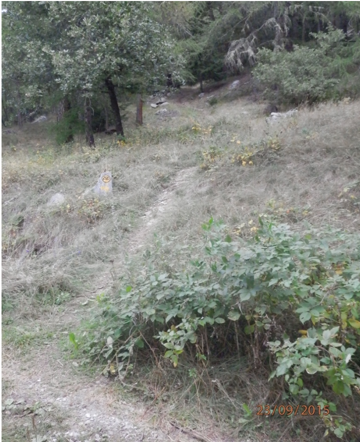
A sinistra arrivo al K1000, a destra il bivio per continua a salire verso il Mont Mary.