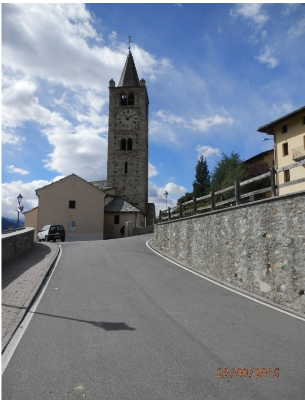
Passaggio nel centro storico nei pressi della chiesa di San-Cristoforo, svoltare a DX.