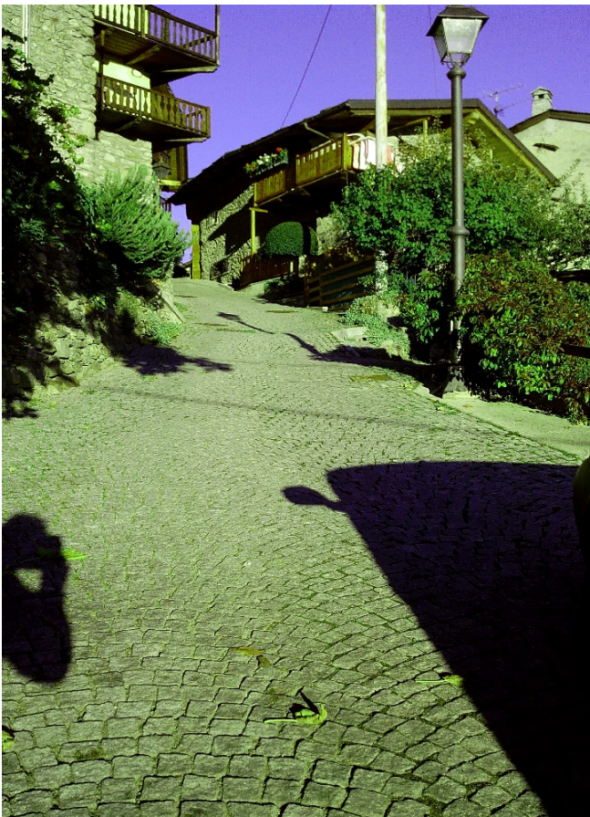
Ultimi villaggi del Comune di Saint – Christophe ; fatti 300 m di dislivello.